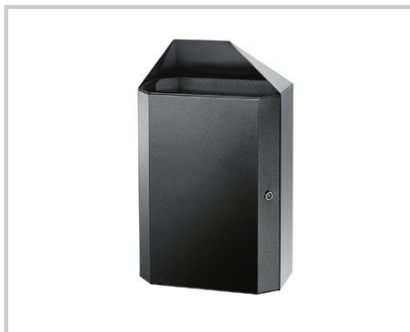
VERSIONE VERNICIATO - POWDER PAINTED