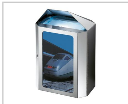
VERSIONE INOX - STAINLESS STEEL