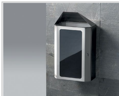
FISSAGGIO A MURO - WALL FIXING