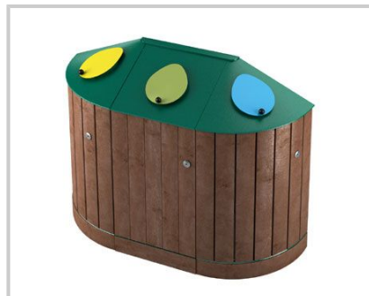
EGADI TRIO - 3 CONTENITORI - 3 BINS