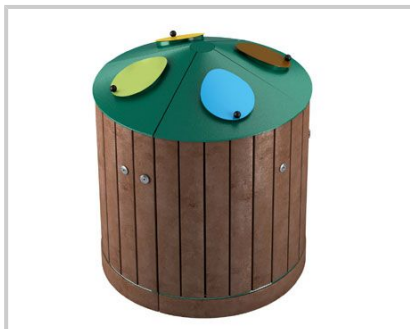
EGADI CIRCOLO - 4 CONTENITORI - 4 BINS