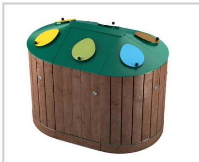
EGADI SESTO - 6 CONTENITORI - 6 BINS