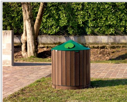
EGADI CIRCOLO - 4 CONTENITORI - 4 BINS