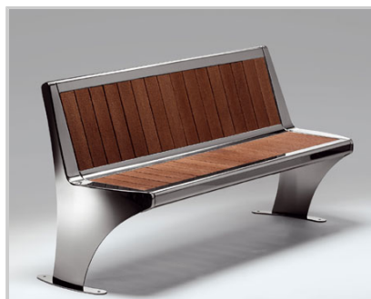
BABILONIA INOX/STAINLESS STEEL + RECYCLED PLASTIC