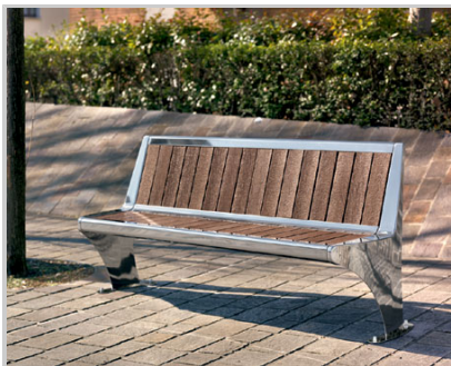
BABILONIA INOX/STAINLESS STEEL + RECYCLED PLASTIC