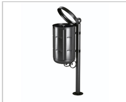
Anello reggi sacco