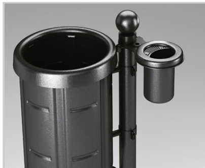
APOLLO + DELFO