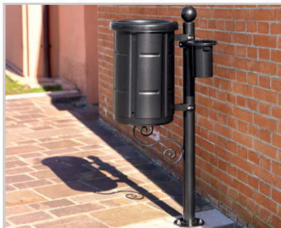
APOLLO + DELFO